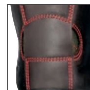
HAIX® FP System